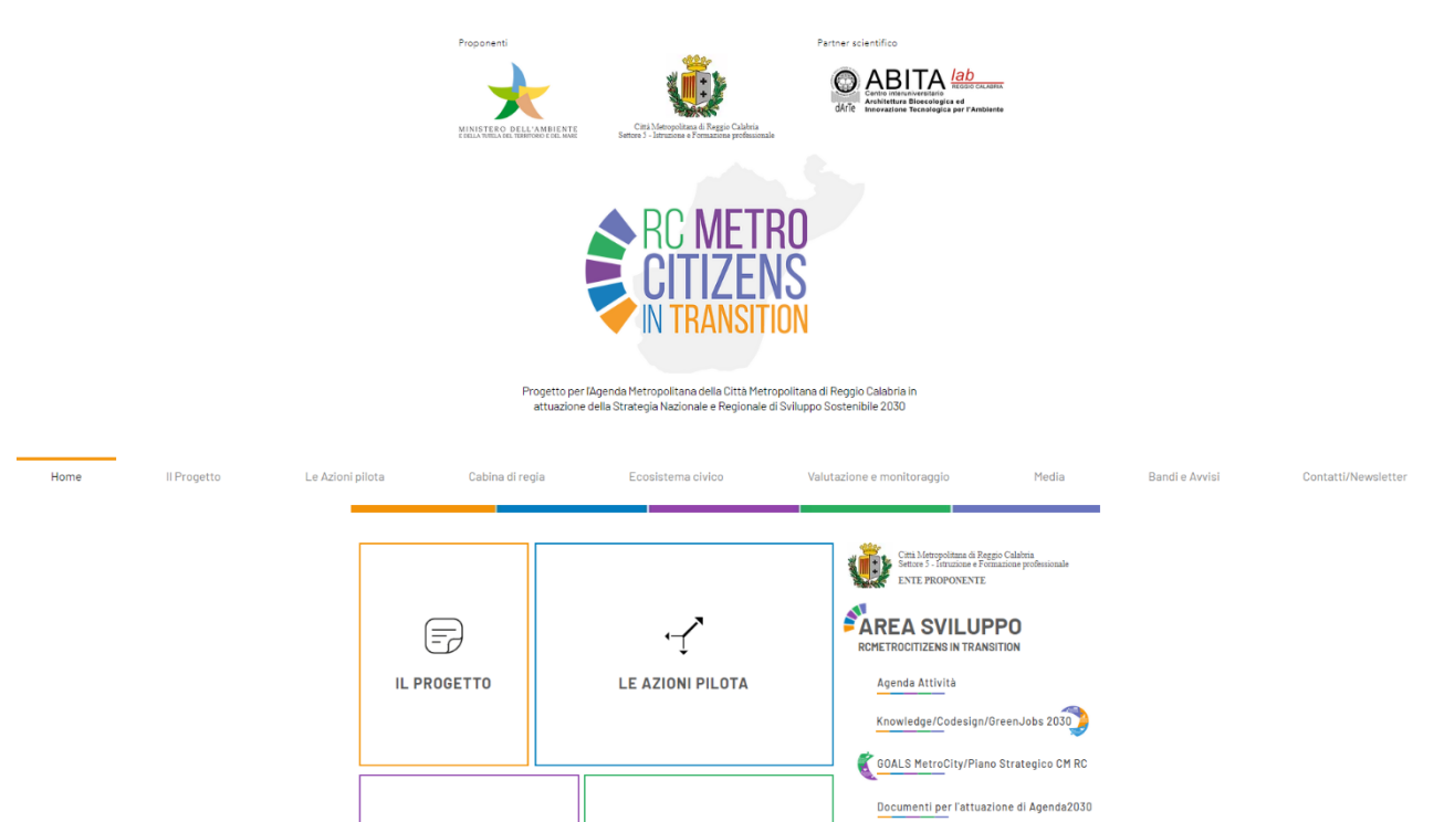
Estratto dal mockup della homepage con i contenuti essenziali

La sitemap è la mappa che elenca gerarchicamente tutte le pagine di un sito web. Viene realizzata e impiegata per presentare la struttura e l’architettura del sito, ma anche facilitare la navigazione di siti complessi quando è cliccabile sul sito stesso. La Site Map contiene tutti gli url delle pagine del sito e relativi contenuti, in modo da facilitare anche l’indicizzazione sui motori di ricerca.